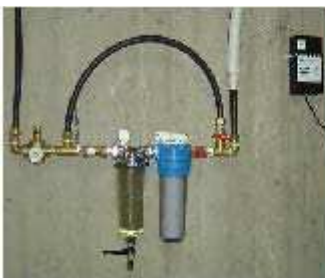
ΦΙΛΤΡΑ ΚΕΝΤΡΙΚΗΣ ΠΑΡΟΧΗΣ

ΕΙΔΙΚΟ ΜΟΝΤΕΛΛΟ ΓΙΑ ΠΕΡΙΟΧΕΣ ΜΕ ΕΛΑΦΡΑ ΥΦΑΛΜΥΡΟ ΝΕΡΟ ( ΝΗΣΙΑ κ.ΛΤ.)