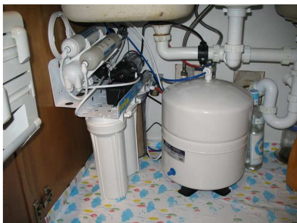
ΣΤΟ ΝΤΟΥΛΑΠΙ ΚΑΤΩ ΑΠΟ ΤΟΝ ΝΕΡΟΧΥΤΗ