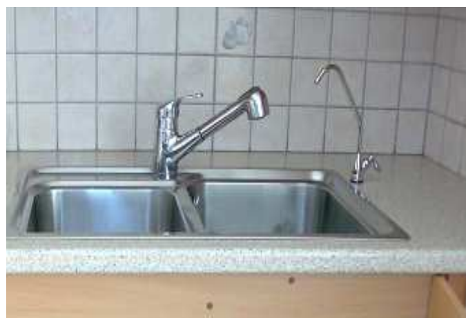
ΒΡΥΣΑΚΙ ΕΠΑΝΩ ΣΤΟΝ ΝΕΡΟΧΥΤΗ (ΔΕΞΙΑ)