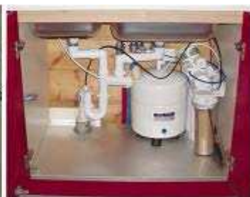
ΦΙΛΤΡΑ ΠΟΣΙΜΟΥ ΝΕΡΟΥ