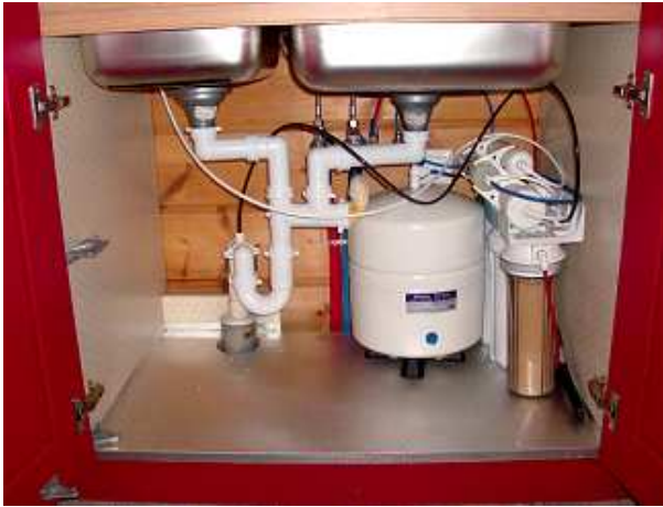
ΣΤΟ ΝΤΟΥΛΑΠΙ ΚΑΤΩ ΑΠΟ ΤΟΝ ΝΕΡΟΧΥΤΗ