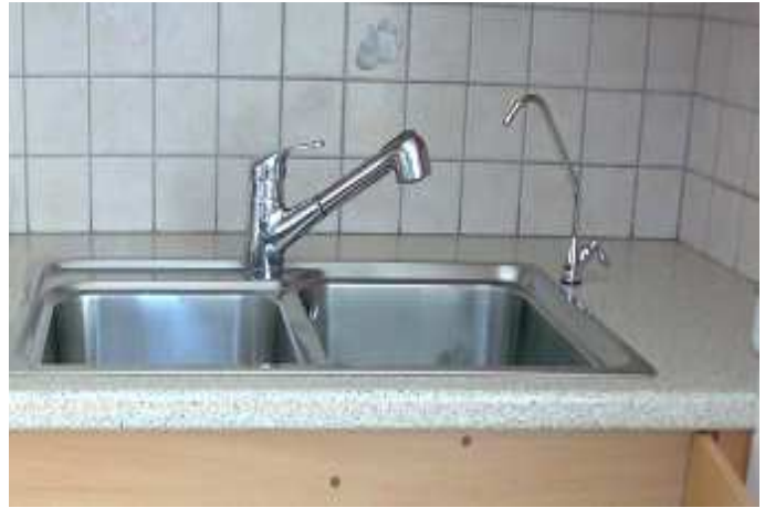
ΒΡΥΣΑΚΙ ΕΠΑΝΩ ΣΤΟΝ ΝΕΡΟΧΥΤΗ (ΔΕΞΙΑ)