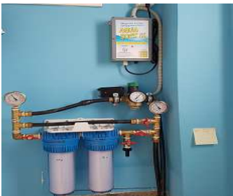
ΦΙΛΤΡΑ ΚΕΝΤΡΙΚΗΣ ΠΑΡΟΧΗΣ