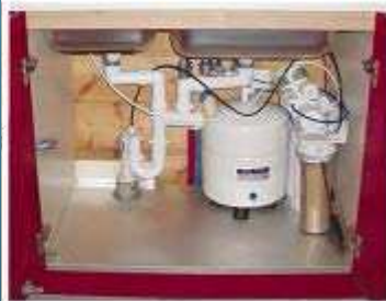
ΦΙΛΤΡΑ ΠΟΣΙΜΟΥ ΝΕΡΟΥ