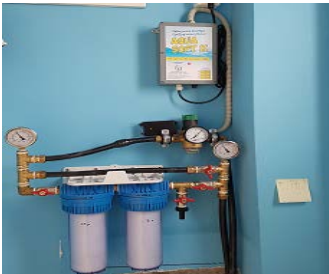
ΦΙΛΤΡΑ ΚΕΝΤΡΙΚΗΣ ΠΑΡΟΧΗΣ