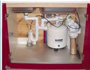
ΦΙΛΤΡΑ ΠΟΣΙΜΟΥ ΝΕΡΟΥ