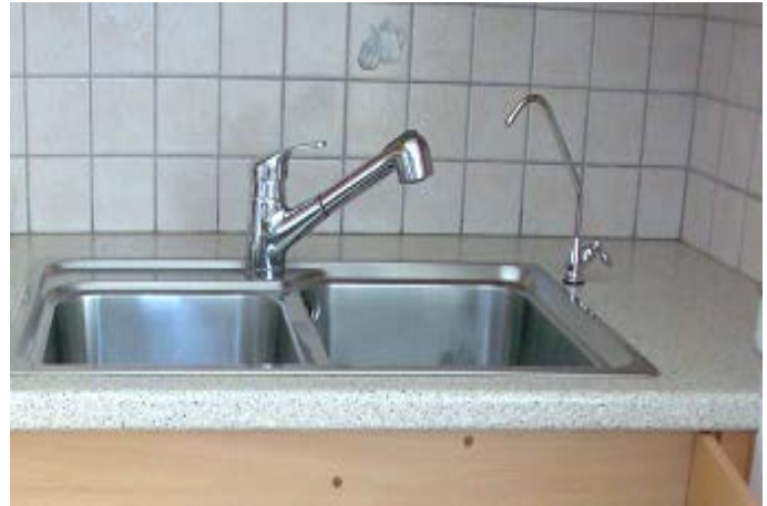
ΒΡΥΣΑΚΙ ΕΠΑΝΩ ΣΤΟΝ ΝΕΡΟΧΥΤΗ (ΔΕΞΙΑ)