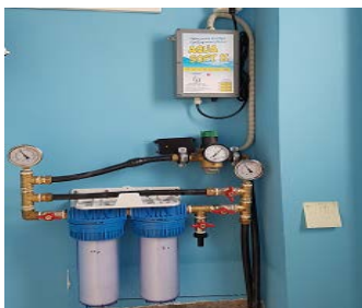
ΦΙΛΤΡΑ ΚΕΝΤΡΙΚΗΣ ΠΑΡΟΧΗΣ