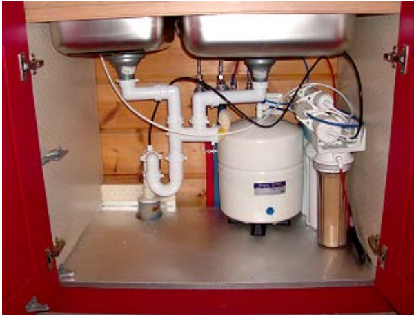
ΣΤΟ ΝΤΟΥΛΑΠΙ ΚΑΤΩ ΑΠΟ ΤΟΝ ΝΕΡΟΧΥΤΗ