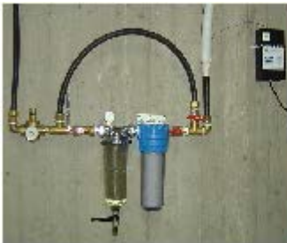
ΦΙΛΤΡΑ ΚΕΝΤΡΙΚΗΣ ΠΑΡΟΧΗΣ

ΕΙΔΙΚΟ ΜΟΝΤΕΛΛΟ ΓΙΑ ΠΕΡΙΟΧΕΣ ΜΕ ΕΛΑΦΡΑ ΥΦΑΛΜΥΡΟ ΝΕΡΟ ( ΝΗΣΙΑ κ.λπ.)