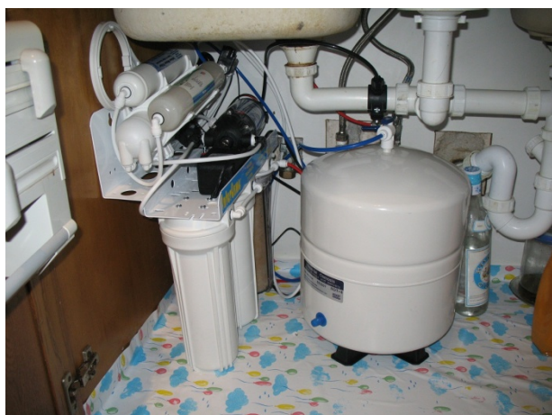
ΣΤΟ ΝΤΟΥΛΑΠΙ ΚΑΤΩ ΑΠΟ ΤΟΝ ΝΕΡΟΧΥΤΗ