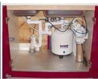
ΦΙΛΤΡΑ ΠΟΣΙΜΟΥ ΝΕΡΟΥ