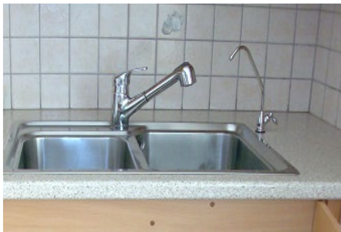
ΒΡΥΣΑΚΙ ΕΠΑΝΩ ΣΤΟΝ ΝΕΡΟΧΥΤΗ (ΔΕΞΙΑ)