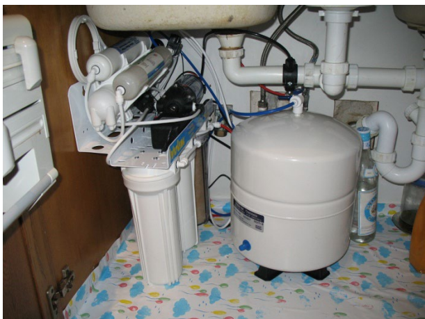
ΣΤΟ ΝΤΟΥΛΑΠΙ ΚΑΤΩ ΑΠΟ ΤΟΝ ΝΕΡΟΧΥΤΗ